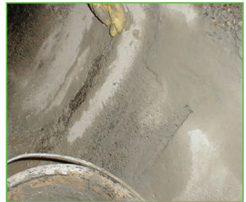
Surface traitée et lissée