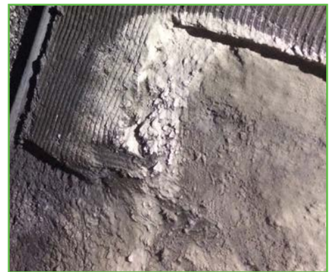
Suintement stoppé avec ERGELIT-10FR