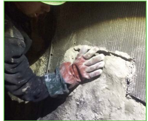
ERGELIT-10FR à sec sur la venue d'eau