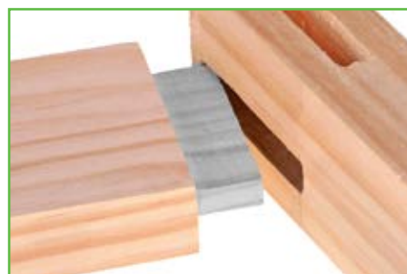
Encastrer le 10SD façon "assemblage bois"