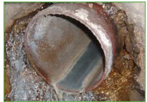
Infiltration d'eau franche