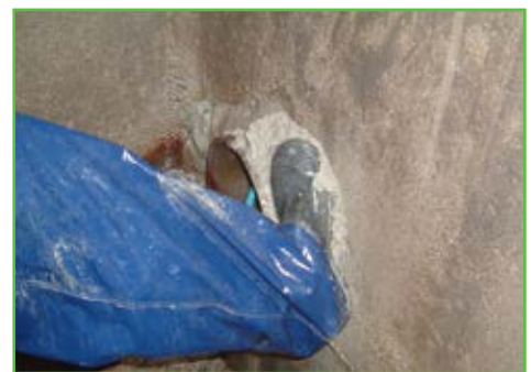
Encastrer ERGELIT-10SD dans la fuite