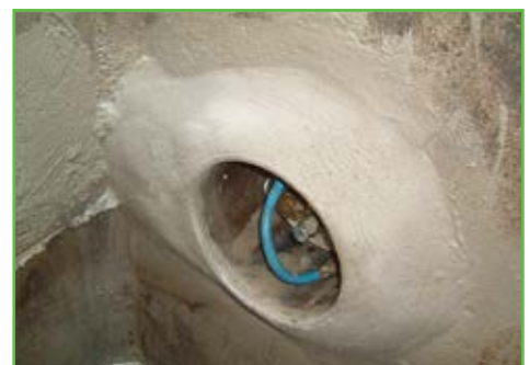
Fuite stoppée, finition avec ERGELIT-KS1