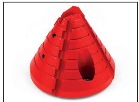
Fraise pyramidale de la gamme chemisage