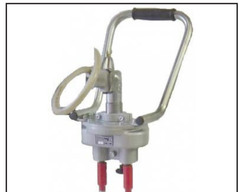
B7-D – Version pneumatique