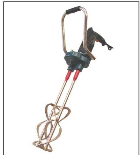
B7 – Version électrique